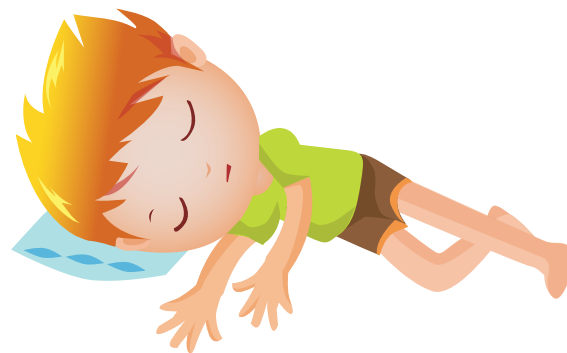
Rys. 4. Bezpieczne ułożenie dziecka z zaburzeniami świadomości, drgawkami

Unikać poruszania bolącego miejsca. Zapewnić możliwość, jak najszybszego dożylnego podania koncentratu czynnika krzepnięcia, którego dziecku brakuje z powodu choroby.