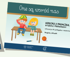
DZIECKO Z PADACZKĄ W SZKOLE I PRZEDSZKOLU