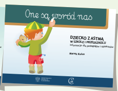
DZIECKO Z ASTMĄ W SZKOLE I PRZEDSZKOLU