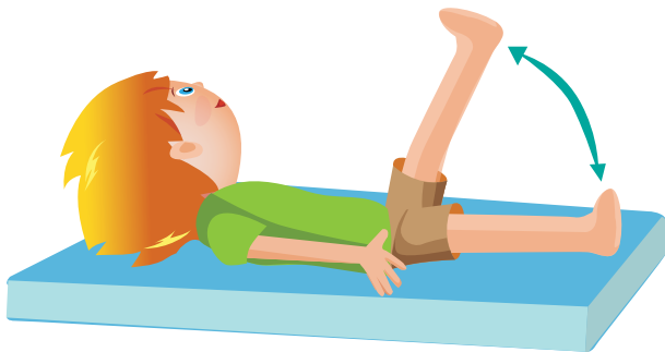
Rys. 1. Ćwiczenia gimnastyczne na materacu, unoszenie nóg