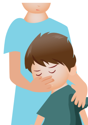
Rys. 3. Zatrzymanie krwawienia z nosa

W przypadku urazu lub/i bólu należy oziębic dotkniętą część ciała przez przyłożenie lodu, zimnego okładu żelowego lub chustki (szalika) zmoczonego w zimnej wodzie. Posadzić lub położyć dziecko w pozycji dla niego wygodnej. Najczęściej jednak podanie koncentratu czynnika krzepnięcia jest nieuniknione (patrz punkt 8). Przy krwawieniu z nosa dziecko powinno siedzieć z głową lekko pochyloną do przodu, należy oziębic czoło i mocno zacisnąć palcem z zewnątrz przez chusteczkę światło przewodu nosowego, przyciskając skrzydełko nosa do twardej przegrody nosa na 5–10 minut. Jeżeli wystąpi uszkodzenie skóry, należy ją przemyć i założyć opatrunek z lekkim uciskiem. Przy większym uszkodzeniu dodatkowo może być wskazane po-