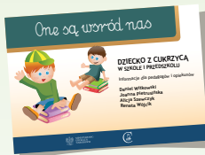
DZIECKO Z CUKRZYCĄ W SZKOLE I PRZEDSZKOLU

Dotychczas w serii „One są wśród nas” ukazały się: