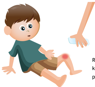
Rys. 2. Chłopiec z obrzękniętym kolaniem, nad nim ręce przykładające okład oziębiający

Najczęściej dziecko samo zgłasza, że coś zaczyna się z nim dziać. Związane jest to z bólem, a ból z krwawieniem.