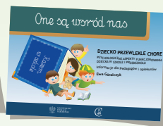
DZIECKO PRZEWLEKLE CHORE PSYCHOLOGICZNE ASPEKTY FUNKCJONOWANIA DZIECKA W SZKOLE I PRZEDSZKOLU