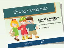
DZIECKO Z HEMOFILIĄ W SZKOLE I PRZEDSZKOLU